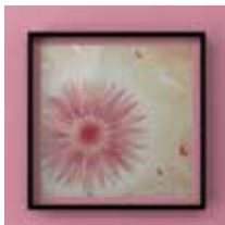
イメージ図となります。 15cm角サイズの作品制作となります。